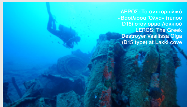
ΛΕΡΟΣ: Το αντιτορπιλικό «Βασίλισσα Όλγα» (τύπου D15) στον όρμο Λακκίου / LEROS: The Greek Destroyer Vasilissa Olga (D15 type) at Lakki cove