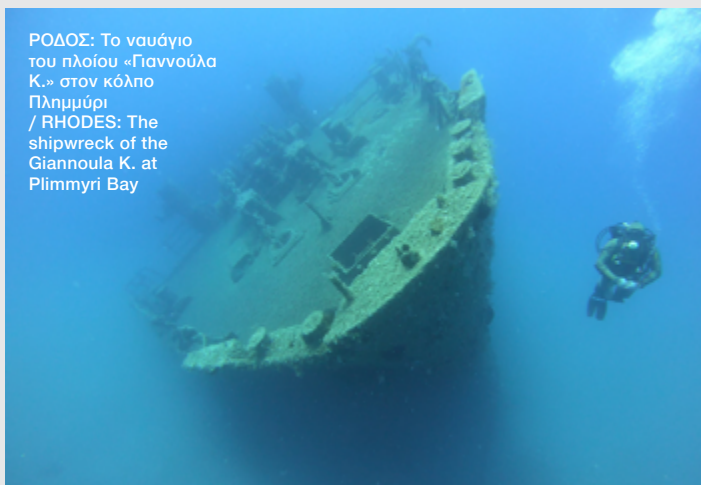
ΡΟΔΟΣ: Το ναυάγιο του πλοίου «Γιαννούλα Κ.» στον κόλπο Πλημμύρι / RHODES: The shipwreck of the Giannoula K. at Plimmyri Bay