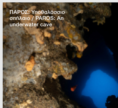
ΠΑΡΟΣ: Υποθαλάσσιο σπήλαιο / PAROS: An underwater cave

Συγχρηματοδοτείται από την Ευρωπαϊκή Ένωση (ΕΤΠΑ) και από εθνικούς πόρους της Ελλάδας και της Κύπρου. ΠΛΗΡΟΦΟΡΙΕΣ: www.andikat.eu Co-financed by the European Regional Development Fund and by national resources of Greece and Cyprus INFORMATION: www.andikat.eu